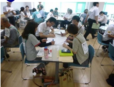
環境教育ネットワーク推進会議の様子