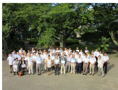
ネットワーク参加団体で記念撮影